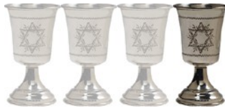
Llenamos la primera copa

E stoy dispuesto para cumplir con el precepto de beber la primera de las cuatro copas. Esto recuerda la promesa de redención del Dios al pueblo de Israel como dice. "...y os liberaré de la carga de los egipcios...".